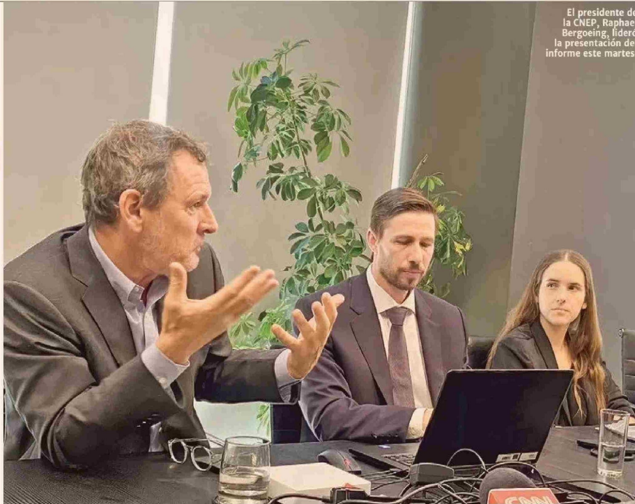
El presidente de la CNEP, Raphael Bergoing, lideró la presentación del informe este martes.

capital humano y eficiencia en general, fue menor.