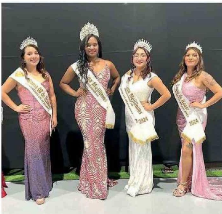
PARTICIPARON SEIS MUJERES EN EL CONCURSO.