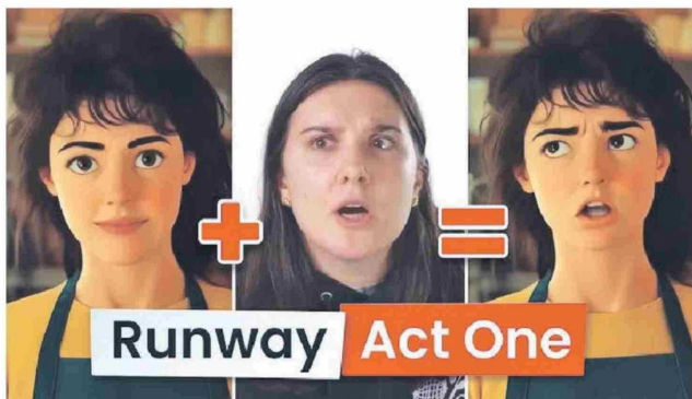
► El año pasado Runway lanzó Act One, un software que permite dar expresiones y movimientos humanos a los personajes generados por inteligencia artificial.