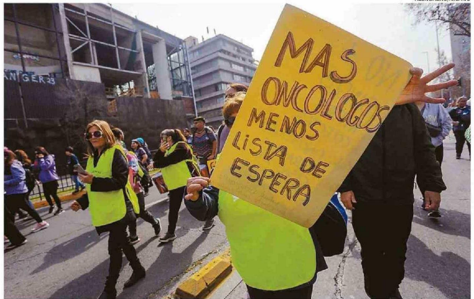
A NIVEL NACIONAL, MÁS DE 373 MIL PACIENTES ESTÁN A LA ESPERA PARA CIRUGÍAS MAYORES. COSTO SUPERA 400 MIL MILLONES DE PESOS.

En este contexto, para el parlamentario y también médico, esta realidad en lo que atañe a todo el país “no ha podido ser manejada adecuadamente desde el Minsal ni desde los servicios de salud”.