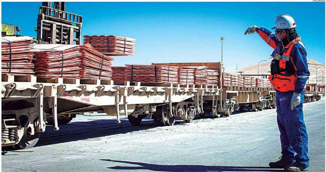
LAS MINERAS POTENCIAN SUS FAENAS PARA MANTENER NIVELES DE PRODUCCIÓN.

José Fco. Montecino Lemus cronica@mercurioantofagasta.cl