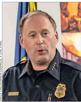
CHILE CALIFORNIA COUNCIL Y CAL FIRE

grafía, con pendientes pronunciadas y cañones, también contribuye a la rápida propagación de incendios forestales”. Y sostiene que “ambos enfrentamos el desafío de la interfaz urbano-rural, con viviendas construidas cerca o dentro de los bosques, aumentando el riesgo para las comunidades”.