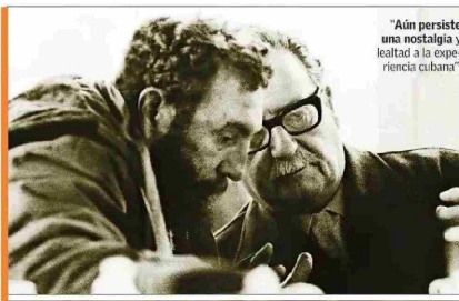
"Aún persiste una nostalgia y lealtad a la experiencia cubana".