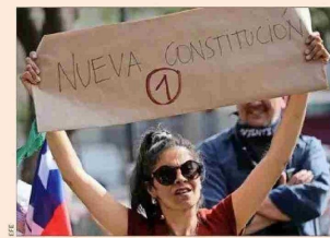
"El lazo más claro entre el periodo que estudio y la época actual, sobre todo entre 2019 y 2022, es la impugnación de la democracia vigente y la búsqueda de una 'democracia nueva'".

"El vínculo más claro que podría establecer entre el periodo que estudio y la época actual, en especial entre 2019 y 2022, es la impugnación de la democracia vigente, la reivindicación de un 'pueblo' oprimido y la convicción de que es posible crear una nueva y más verdadera democracia, en particular a través de una nueva Constitución paritaria y plurinacional. En muchos sentidos, el pensamiento sobre la democracia en Chile a mediados del siglo XX tuvo mucho de impugnación de la democracia liberal y, en su resaca, de un 'pueblo' oprimido por ella, fue también un pensamiento de visos populistas, si es que pensamos en la definición actual de populismo."