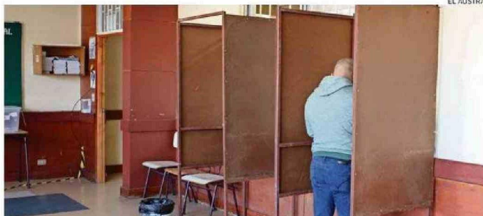
LAS ELECCIONES SE REALIZARÁN DURANTE LAS JORNADAS DEL SÁBADO 26 Y DOMINGO 27 EN TODO EL PAÍS.

dejan sus funciones los alcaldes que buscan la reelección para sumarse a sus campañas. Serán subrogados por directivos municipales durante 30 días.