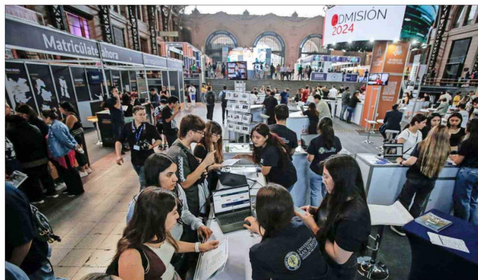
En el oficialismo creen que el proyecto que crea el FES y termina con el CAE será un complemento de la gratuidad para estudiantes de universidades e institutos.

En el proyecto del FES, se propone que para alcanzar recién el séptimo decil la recaudación fiscal estructural deberá representar el 29,5% del PIB tendencial no minero. Ese porcentaje hoy es el umbral necesario para la gratuidad universal. También se