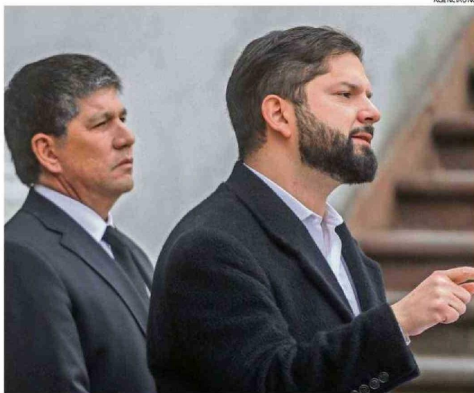
EL JEFE DE ESTADO (DER.) HABLÓ AYER JUNTO AL MINISTRO DE ENERGÍA Y EL SUBSECRETARIO DEL INTERIOR (IZQ.).

“Hay empresas, como Enel, que han buscado ahorrarse plata cuando hay gente que todavía está sin luz en las calles. Eso, desde mi punto de vista como Presidente de la República, es absolutamente inaceptable y deteriora, por cierto, la credibilidad de las empresas y le hace un grave daño a este sector”, dijo el mandatario en La Moneda.