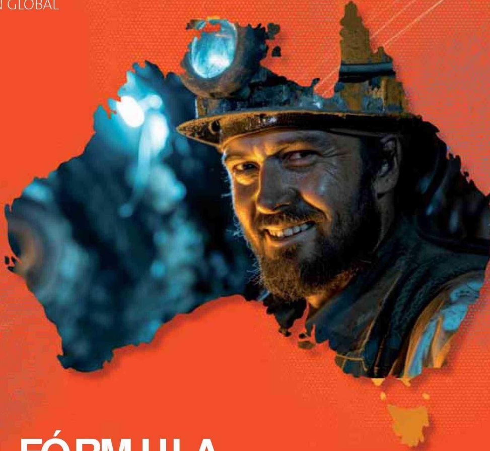
Ilustración: Fabiana Rivero