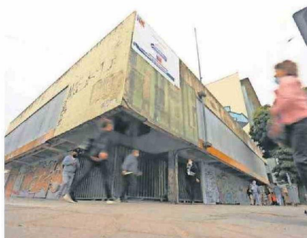
El exedificio de la Contraloría Regional, inutilizable tras el 27/F, recibirá al centro oncológico del Servicio de Salud Concepción.

pondientes a la glosa 07 del presupuesto asignado al ítem de gastos de emergencia, que permitirán llevar adelante la demolición por parte de la empresa Flesan adjudicada a mediados de diciembre para concretar el proceso hasta