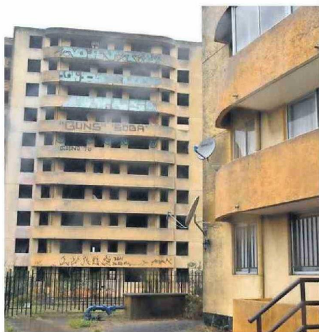
Hoy comienza formalmente la demolición de la torre C del complejo Puerto de Palos de Hualpén.