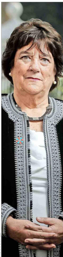
Adriana Delpiano, titular de Educación entre 2015 y 2018.

“Hay bastante evidencia que muestra un sesgo que aún persiste en la formación de las matemáticas entre hombres y mujeres, que aún afecta a muchas veces a las alumnas, y eso hace que estas brechas se sigan manifestando. Creo que es importante seguir trabajando en políticas que permitan identificar la existencia de esos sesgos y que se tomen las medidas para ir revertiéndolas (...). En la medida que pongamos el foco de la política pública donde debe estar, esto es, en los aprendizajes, en la sala de clases, en las posibilidades de cada establecimiento de poder desarrollar con autonomía sus proyectos, los resultados van a tender a la mejora”.