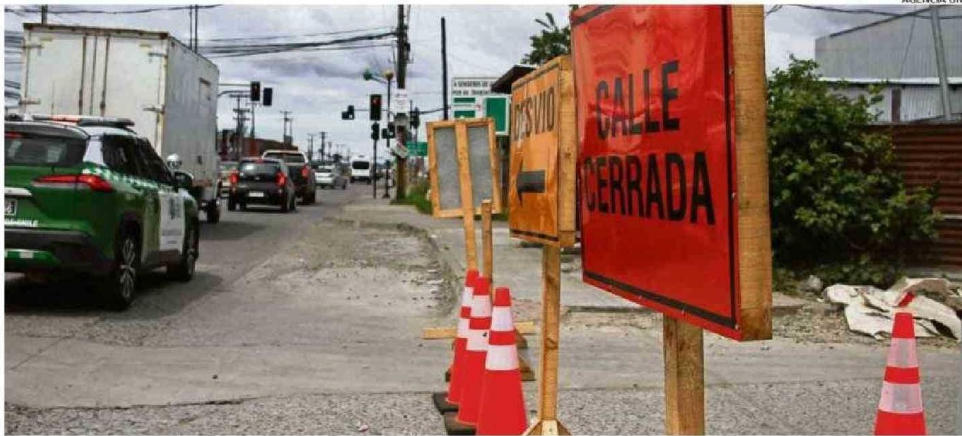
EN EFE EXPLICAN QUE ESTÁN TRABAJANDO EN LA REHABILITACIÓN DE LOS CRUCES FERROVIARIOS.