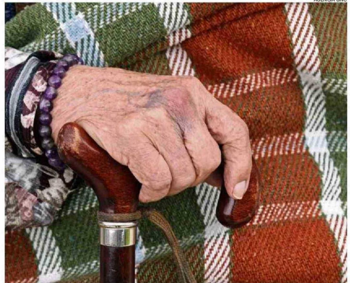
UN FACTOR CRÍTICO ES LA SALUD DENTAL Y VISUAL DE ADULTOS MAYORES: MUCHOS NO PUEDEN LEER ETIQUETAS.

mentaria se refiere a "la disponibilidad limitada o incierta de alimentos por factores sociodemográficos, ingreso económico, conocimientos y habilidades nutricionales, cercanía con lugares de abastecimiento, red de apoyo y otros".