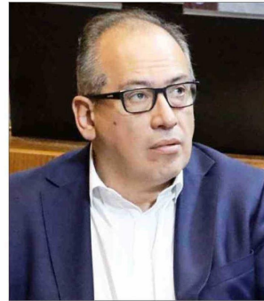
GASTÓN SAAVEDRA SENADOR PS

“En vez de estar con los pies en la calle y en La Moneda, es mejor poner los pies en la tierra. Creo que es una irresponsabilidad llamar a movilizaciones sociales para sacar adelante reformas como la de pensiones”.