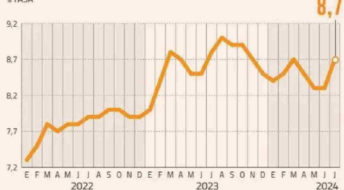
LA TRAYECTORIA DEL DESEMPEÑO % TASA