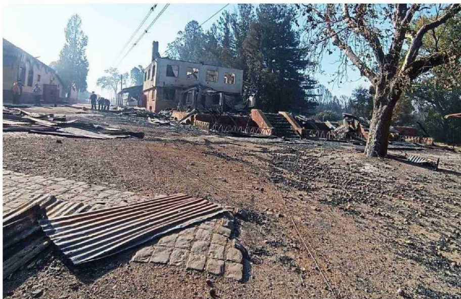
EL INCENDIO FORESTAL DEL DOMINGO EN TRAIGUÉN AVANZÓ HASTA EL FUNDO LA ESPERANZA, DESTRUYENDO EL 60% DE LAS INSTALACIONES DEL LICEO.