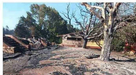
LOS AÑOSOS ÁRBOLES TAMBIÉN RESULTARON QUEMADOS.