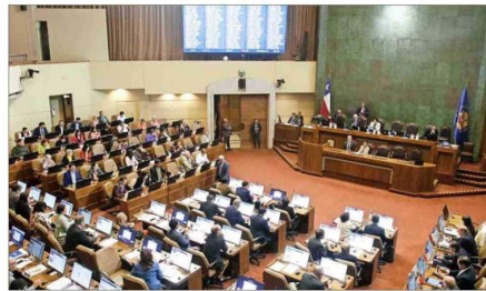
Durante toda esta semana se extenderá la votación del Presupuesto 2025 en la Sala de la Cámara de Diputados.

El ministro también hizo mención a la reducción del número de conscriptos en los últimos años, lo que ha afectado el flujo de estos hacia el escalafón de soldados profesionales. "Entre 2018 y 2022 la dotación de soldados conscriptos se redujo de 11 mil a 5 mil. Posteriormente, hubo un incremento en los últimos dos años, se ha aumentado en cerca de mil los soldados conscriptos. Al haber una reducción en el número de conscriptos, naturalmente hay un menor contingente de potenciales entrantes a la tropa profesional y eso hizo que prácticamente en todos los años, desde 2018 hasta ahora, siempre la do-