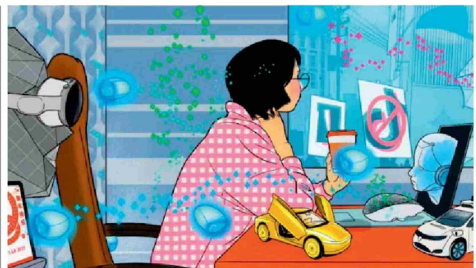
THE WALL STREET JOURNAL. Los adelantos tecnológicos que marcarán el 2025