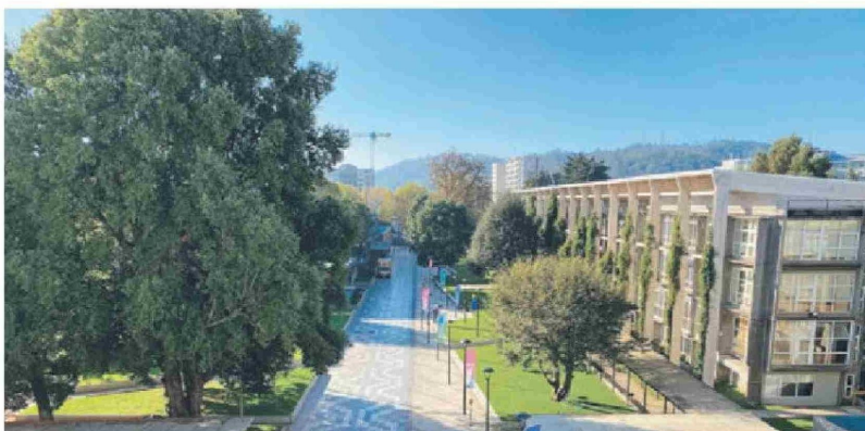
Campus San Francisco.

Nuestra región nos desafía a ser una universidad en diálogo con su entorno. Hemos fortalecido el trabajo con comunidades mapuche y promovido iniciativas que valoran la interculturalidad. Nuestra ma-