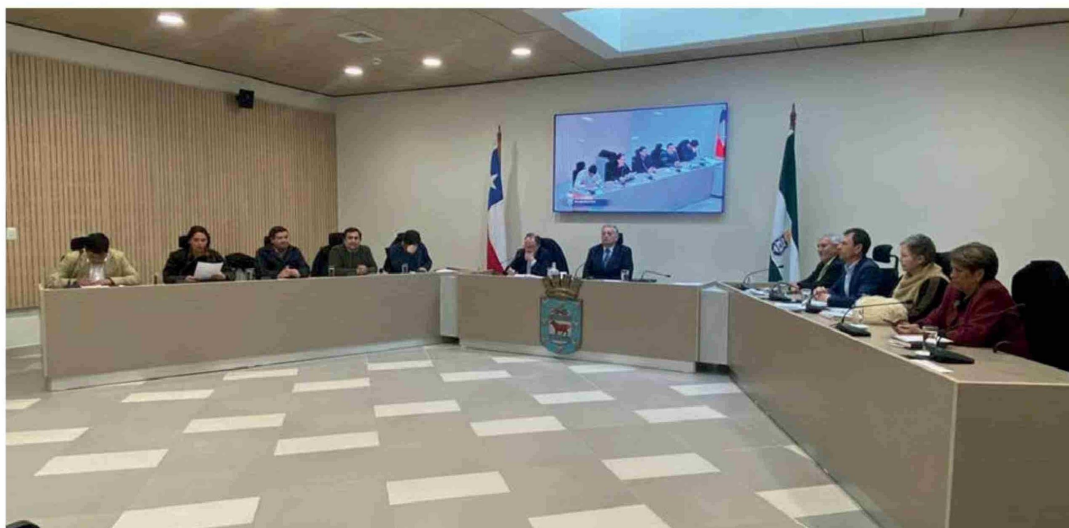
EL CONCEJO MUNICIPAL DE LOS ÁNGELES sesionó el martes en las flamantes instalaciones del edificio “Libertador Bernardo O’Higgins”.

En el proceso de restauración, en 2017 el tribunal ambiental de Valdivia acogió un requerimiento de la Corporación de Defensa del Patrimonio de Los Ángeles que advirtió que el proyecto municipal alteraba la estructura original del edificio al incluir un tercer piso, lo que debió ser demolido.