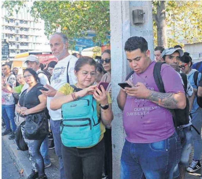
PERSONAS TRATANDO DE ABORDAR MICRO LUEGO DE SALIR DE SUS LUGARES DE TRABAJO.

gía de la Universidad Católica de la Santísima Concepción, puntualizó que "el corte de suministro eléctrico se produjo por una falla en la línea de transmisión de 500 kV en la zona del norte chico, lo que desencadenó un blackout que afectó al sistema eléctrico nacional, abarcando gran parte del norte, centro y sur de Chile".