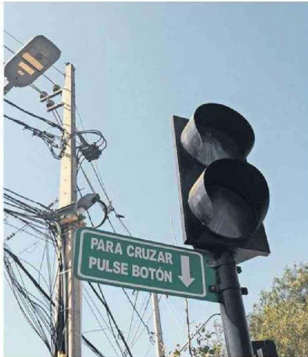
SEMAFOROS APAGADOS GENERARON PROBLEMAS EN EL TRÁNSITO.