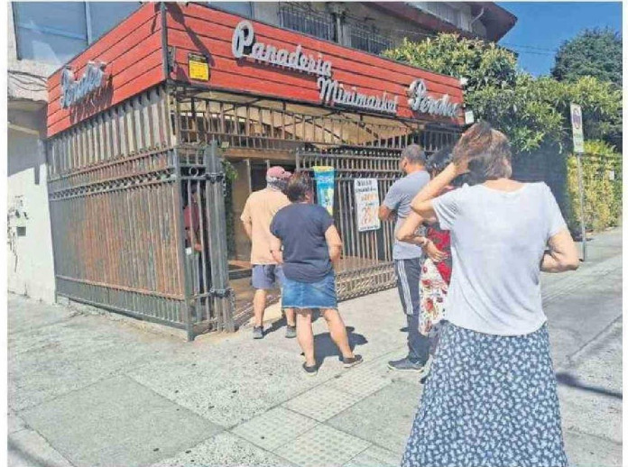
MUCHOS VECINOS SALIERON DE SUS CASAS PARA ABASTECERSE POR MIEDO A PROLONGACIÓN