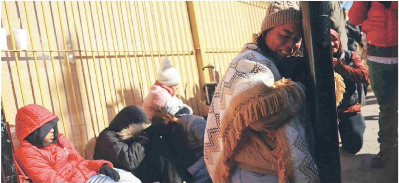
▶ Migrantes que buscan asilo en Estados Unidos esperan en el puente fronterizo internacional Paso del Norte, en Ciudad Juárez, México.