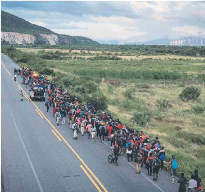
► Una caravana de migrantes escoltada por policías avanza en el sur de México.

dada a través de CBP One. Pero tras recibir la noticia de que se había cancelado, “entró en un estado de crisis emocional. Ella nos reportó incertidumbre, ansiedad y desesperanza. Aunque logramos dar la contención en ese momento, el impacto de la noticia sigue estando presente. La paciente tiene un aumento significativo en sus síntomas depresivos. Hoy se encuentra en un estado de profunda tristeza, sin ánimos para levantarse de la cama o para realizar sus actividades básicas”, explicó la psicóloga clínica.