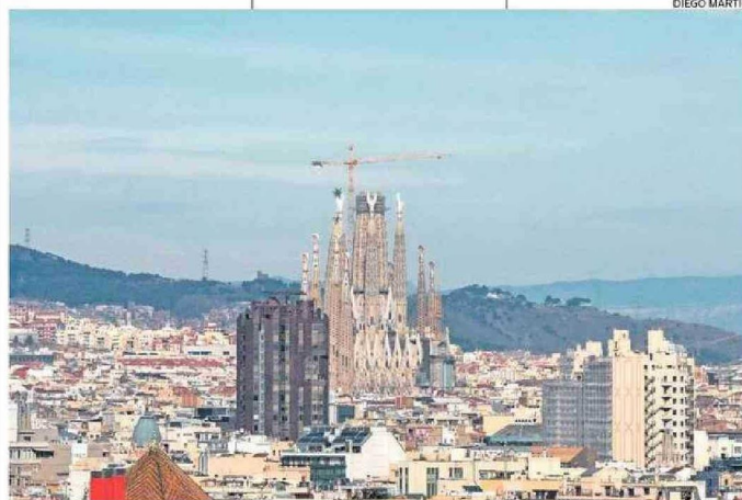
BARCELONA ES UNA CIUDAD COMPACTA DE ALTA DENSIDAD, SEGÚN EL ESTUDIO.