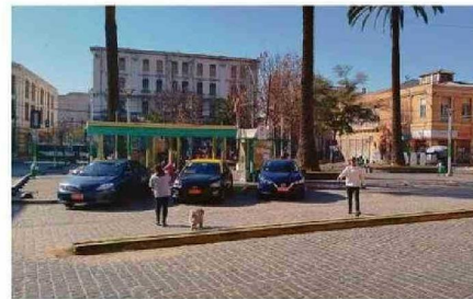
VECINOS ACUSAN DELINCUENCIA Y POCO TRÁNSITO EN EL SECTOR.