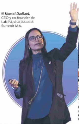
© Komal Dadlani , CEO y co-founder de Lab4U, charlista del Summit IAA.