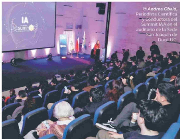
© Andrés Obald , Periodista Científica y conductora del Summit IAA en el auditorio de la Sede San Joaquín de Duoc UC.