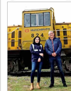
La historia y los recuerdos de una familia ligada por más de cinco décadas a la siderúrgica Huachipato, en la hora del cierre.