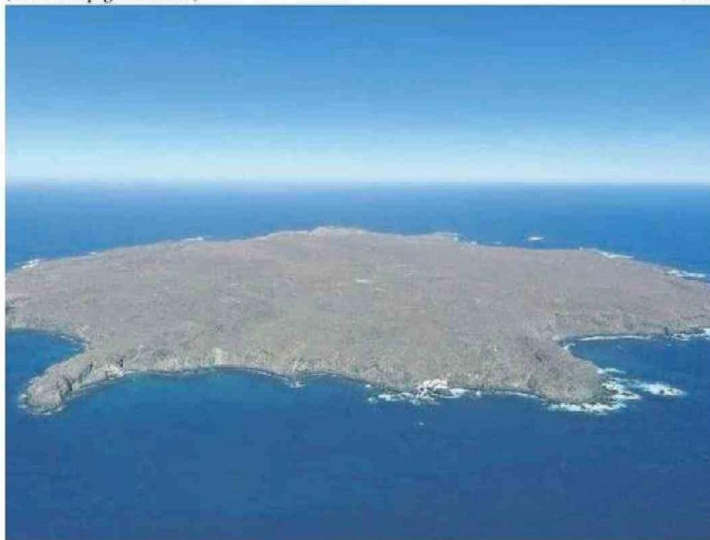
LA RESERVA MARINA ISLA CHAÑARAL ES UN ÁREA PROTEGIDA.

Dentro de los hallazgos obtenidos por el proyecto está el buen estado de salud de la población de los recursos que son de importancia comercial para la pesca artesanal en la reserva y las Áreas de Manejo de Reservas Bentónicas (AMERB) aledañas. Una situación similar se constató al apreciar la abundancia y riqueza significativa de peces vinculados a los bosques de macroalgas, en especial el huiro palo.