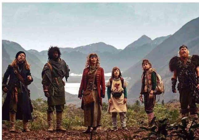
"LOS HÉROES DEL TIEMPO" ADAPTA EN FORMATO SERIE DE LA PELÍCULA DE CULTO DE 1981 "TIME BANDITS".

1999, regresa a las pantallas. La producción que rápidamente se convirtió en un fenómeno global, adaptada en numerosos países, estrena una secuela que transcurre 25 años después, la cual mostrará cómo ha evolucionado la vida de los conocidos personajes de la ficción. La trama original se trata de la vida de Beatriz Pinzón Solano (Ana María Orozco), una mujer inteligente y capaz pero poco atractiva, que consigue trabajo en Ecomoda, una empresa de diseño de vestuario. Allí, se enfrenta a los prejuicios y burlas por su apariencia, pero su talento y ética laboral la destacan, generando un cambio en la percepción de quienes la rodean. La relación entre Betty y Armando Mendoza (Jorge Enrique Abello), el presidente de Ecomoda, es central para la trama, evolucionando de un vínculo profesional a un complejo romance. La secuela explorará la vida de Betty como madre y esposa. "Mientras una empoderada Betty trabaja duro para reconstruir el vínculo con su hija adolescente, su relación con Armando se está deteriorando rápidamente, lo que la hace cuestionarse si hace 20 años tomó la decisión correcta", revela la sinopsis la serie que Amazon Prime Video estrena el viernes 19.