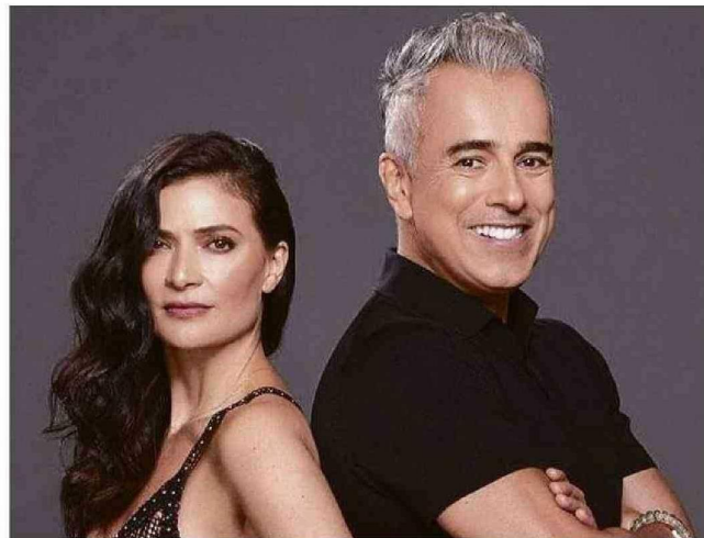
EN "BETTY LA FEA, LA HISTORIA CONTINÚA", LA PROTAGONISTA BUSCA RECONSTRUIR EL VÍNCULO CON SU HIJA, MIENTRAS LA RELACIÓN CON ARMANDO SE DETERIORA.

No negociable: un negociador es convocado para rescatar al presidente de México de un secuestro, pero la misión incluye intentar salvar a su propia esposa y su matrimonio. Comedia y acción se mezclan en esta cinta que llega a Netflix el viernes 26.