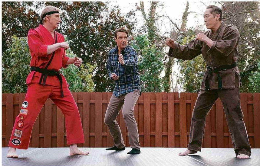
LA SEXTA TEMPORADA DE "COBRA KAI" SE CENTRAN EN LOS PREPARATIVOS DEL MUNDIAL DE KARATE.

Goyo: un hombre del espectro autista, fanático de Van Gogh, que trabaja como guía en el Museo de Bellas Artes en la ciudad de Buenos Aires, ve interrumpida su estructurada rutina cuando conoce a Eva, la nueva guardia de