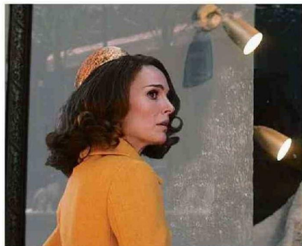
NATALIE PORTMAN INVESTIGA UN CRIMEN EN LA MINISERIE "LA MUJER EN EL LAGO".

El Decamerón: mientras la peste bubónica azota Italia, un grupo de nobles y sirvientes se refugia en una mansión, donde su lujoso escape se convierte en caos. Serie de época, basada en el clásico de