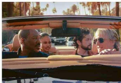
AXEL FOLEY (EDDIE MURPHY) ESTÁ DE VUELTA EN "UN DETECTIVE SUELTO EN HOLLYWOOD 4".

Boccaccio. Desde el jueves 25 en Netflix.