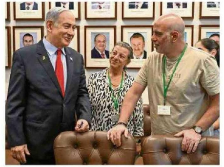
NETANYAHU AYER EN SU RESIDENCIA EN JERUSALÉN, CON UN EXREHÉN.