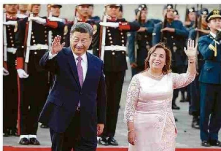
EL PRESIDENTE XI JINPING Y LA PRESIDENTA DE PERÚ, DINA BOLUARTE.