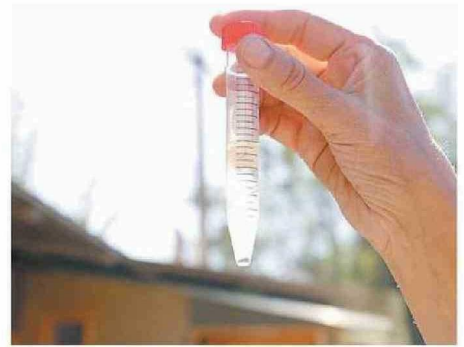
LLAMAN A EVITAR LOS ESPACIOS CON AGUA ESTANCADA.

"El Aedes aegypti puede adquirir el virus al picar a alguien con dengue importado, y posteriormente transmitirlo a una persona sana mediante una picadura. Por eso es fundamental el trabajo