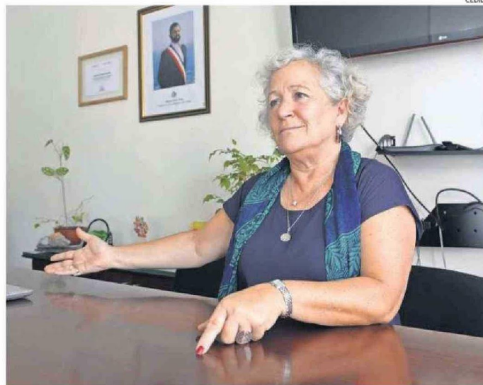
LA DIRECTORA DE SALUD CONFIRMÓ EL PRESUPUESTO BASE PARA EL HOSPITAL REGIONAL.