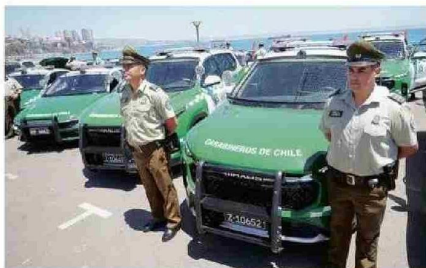
LAS POLICÍAS ZAFARON DEL COMENTADO “EFECTO REBOTE”.

“aunque el ajuste presupuestario busca mantener la disciplina fiscal, es evidente que el país enfrenta desafíos significativos que podrían llevar a nuevos recortes si no se toman medidas proactivas para abordar estos problemas estructurales”. Y opina que “la implementación de reformas fiscales y una gestión más eficiente del gasto son esenciales para evitar un deterioro adicional en los servicios públicos y asegurar el bienestar social a largo plazo”.