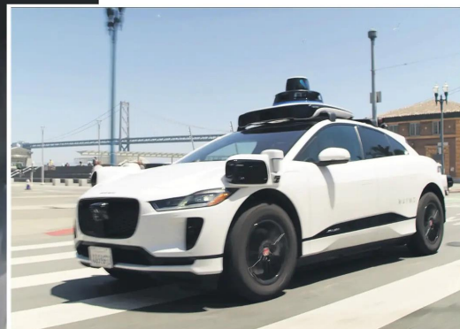
El vehículo es un Jaguar i-Pace, ejemplar eléctrico con 480 km de autonomía.

Esta empresa, según información de su página web ( https://bit.ly/3n6fHdt ), es parte del conglomerado Alphabet, la cual es una filial de Google. Sus servicios