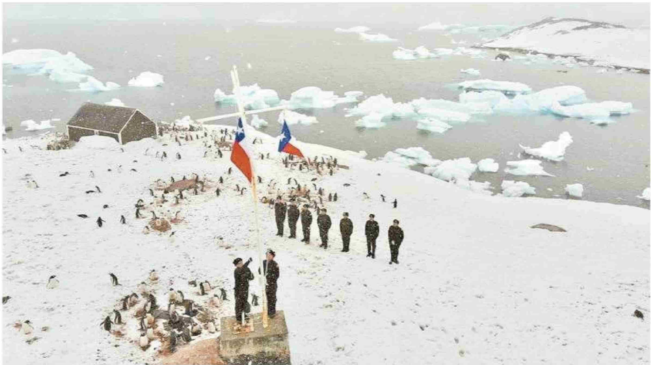
Luego de la construcción de la primera base chilena en 1947, diferentes instituciones decidieron acrecentar la presencia de Chile en la Antártica. Es así que hoy el país mantiene bases y refugios en diferentes lugares de su territorio antártico.

Tiraje: 3.000 Lectoría: 9.000 Favorabilidad: No Definida