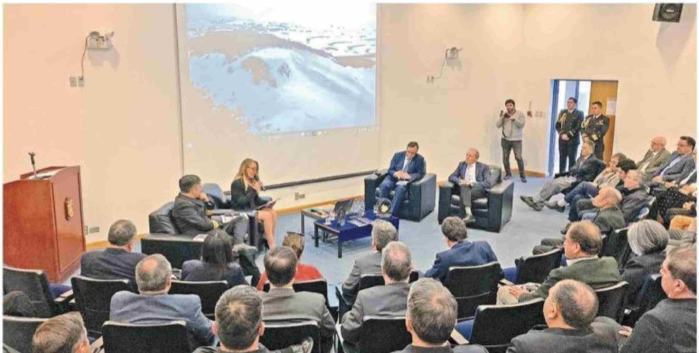
Un aspecto de la presentación del libro "Territorio Chileno Antártico: una mirada multidisciplinaria", en el Hospital de las Fuerzas Armadas de Punta Arenas.

Tiraje: 3.000 Lectoría: 9.000 Favorabilidad: No Definida