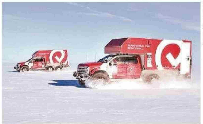
La expedición a través de la Antártica contó con vehículos especiales que resistieran las bajísimas temperaturas.

Transglobal Car arribó a la ciudad tras un mes recorriendo la Antártica