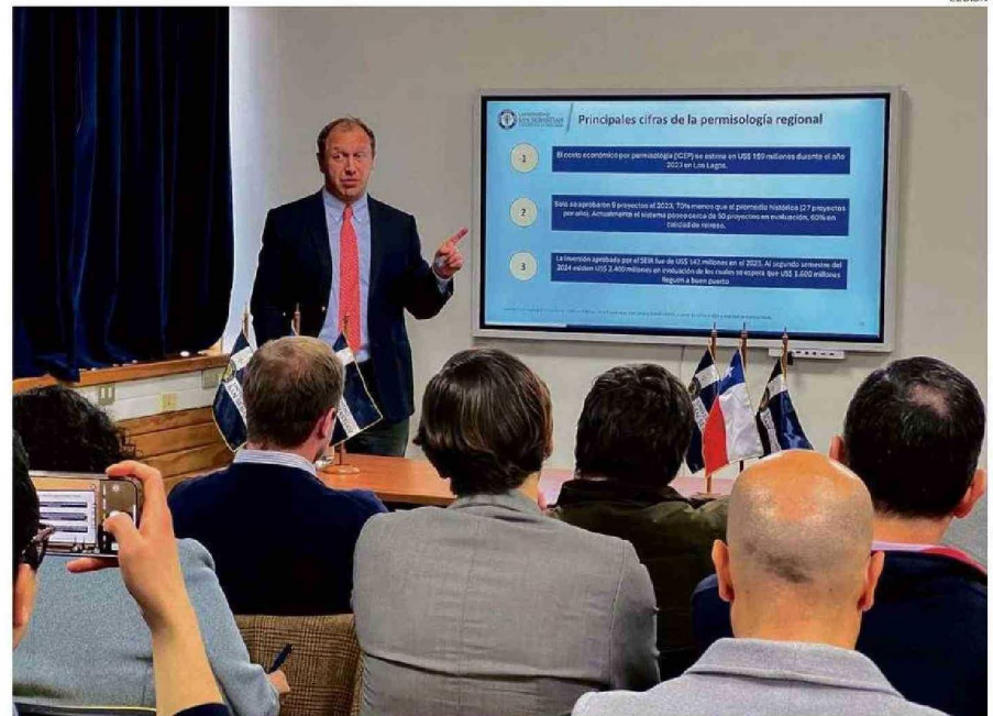
EN LA SEDE DE LA PATAGONIA DE LA USS, TUVO LUGAR LA EXPOSICIÓN DEL ÍNDICE DE COSTO ECONÓMICO POR PERMISOLOGÍA.

"Eso significa que más de la mitad de los recursos que estaban en tramitación no llegaron a puerto, porque el Estado se demoró más de lo que la pro-