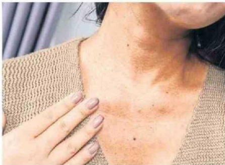
ATENCIÓN CON LAS SEÑALES QUE APARECEN EN EL CUELLO.