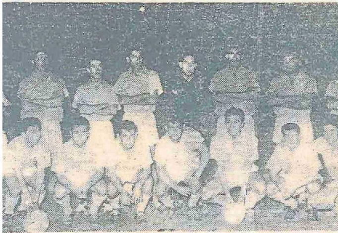
SELECCIÓN EX LIGA 1967 CAMPEONATO NACIONAL "ANDABA" REPRESENTANDO A ARICA EN VALDIVIA.

Sacando a la selección de Arica campeón de Chile en 1988, contando con múltiples disciplinas y siendo la sede del fútbol para más de cinco categorías, el Canal Deportivo Laboral celebra un año más.