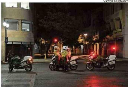
Ayer se levantó el toque de queda para las 14 regiones afectadas.

to se movilizaron todas las capacidades de coordinación y equipos en terreno para restituir, lo antes posible, la disponibilidad de la línea. lo cual se logró a las 4:00 p.m., 44 minutos después de iniciado el evento, quedando disponible para su incorporación al plan de restauración del servicio", y anunció que la firma colaborará con la investigación.