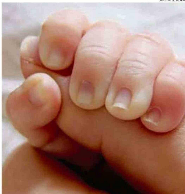
DESDE 2018 A JUNIO DE 2024 A NIVEL NACIONAL HAN LLEGADO A LOS CENTROS DE SALUD 5.370 MUJERES Y NIÑAS QUE HAN TENIDO DERECHO A ACOGERSE A UNA DE LAS TRES CAUSALES DE LA LEY Nº 21.030 O LEY IVE.