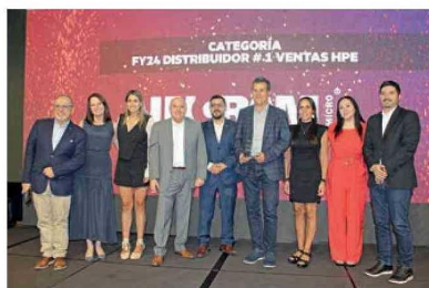
FY24 DISTRIBUIDOR #1 VENTAS HPE INGRAM MICRO