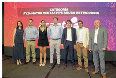
FY24 MAYOR VENTAS HPE ARUBA NETWORKING / ACANTO