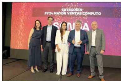
FY24 MAYOR VENTAS COMPUTO SONDA