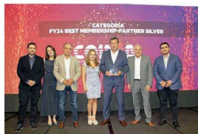
FY24 BEST MEMBERSHIP-PARTNER SILVER COINSA