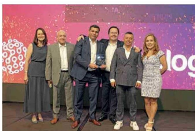
FY24 BEST MEMBERSHIP-PARTNER PLATINUM / GLOBAL CATALOG