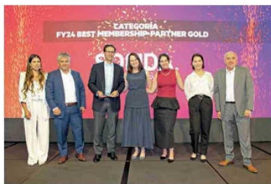
FY24 BEST MEMBERSHIP-PARTNER GOLD SONDA