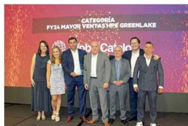
FY24 MAYOR VENTAS HPE GREENLAKE GLOBAL CATALOG