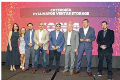
FY24 MAYOR VENTAS STORAGE. COINSA