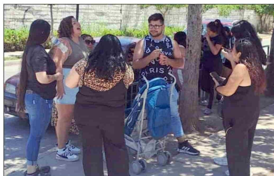
Apoderados reuniéndose afuera del colegio.