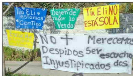
Estos fueron los letreros instalados frente a la Escuela Carmela Carvajal de Prat, en Curimón.

- Igual dicen que echan de menos a la 'tía', de hecho, por todos los paros que se hizo aquí en 'la Carmela' salen el 23 de diciembre, siendo que ya casi todos los niños salieron. Ella fundamenta en la inasistencia de los niños. Nosotros le dijimos en ese momento '¿Inasistencia?', de la cual nosotros somos las que los hacemos faltar, porque en el invierno de verdad hizo frío, a los niños se les llovía la salita, donde ellas salían a jugar al lado de la sala donde estudian, al lado había una y se les llovía. Nosotros como apoderados tuvimos que regalar un calefactor para que lo niños no pasaran frío, eso no tiene solución y a pesar de