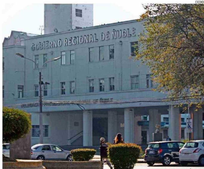
GORE DE ÑUBLE CRARÁ FUNDACIÓN PARA EL DESARROLLO. INICIATIVA GENERA OPINIONES ENCONTRADAS.

"La Corporación Regional para el Desarrollo será una buena instancia en la medida que se cumplan ciertas condiciones que a mi modo de ver son fundamentales. Lo primero es el carácter vinculante de las recomendaciones de esta Corporación con las prioridades del gobernador. No sacamos nada con crear una entidad que proyecte a Ñuble en los próximos años, con proyectos estratégicos, si sus recomendaciones de política pública no son consideradas en la