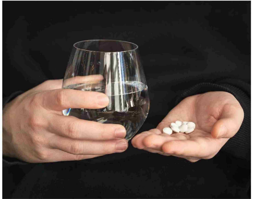
EXPERTOS RECOMIENDAN no beber alcohol en caso de estar bajo tratamiento con antidepresivos o ansiolíticos.