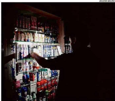
LA EMERGENCIA NO QUEDÓ RESUELTA ANOCHÉ.

En Providencia, uno de los barrios más céntricos de Santiago, la situación era desesperada, con la línea principal del suburbano cortada, los semáforos apagados, grandes atascos y las paradas de los buses llenas, sin opciones para regresar a casa.