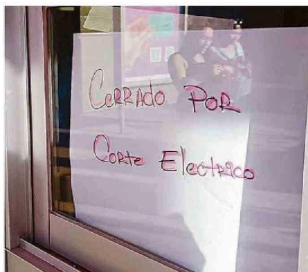
NEGOCIOS NO TUVIERON MÁS ALTERNATIVA QUE CERRAR.