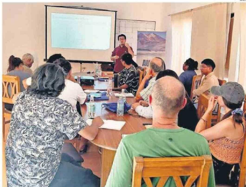
LOS CURSOS FUERON IMPARTIDOS POR ACADÉMICOS DE LA UCN, QUIENES ENTREGARON CONOCIMIENTOS EN OPTIMIZACIÓN DE USO DE AGUA Y PRESERVACIÓN DEL ENTORNO NATURAL.

Los cursos fueron impartidos por académicos de la Universidad Católica del Norte que aportaron sus conocimientos, fundamentalmente en temáticas relacionadas con la optimización del uso del agua y la preservación del entorno natu-