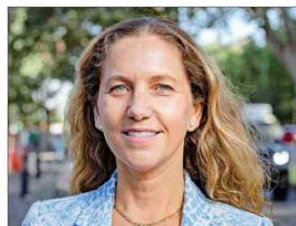
Rosario Navarro, presidenta de la Sofofa.